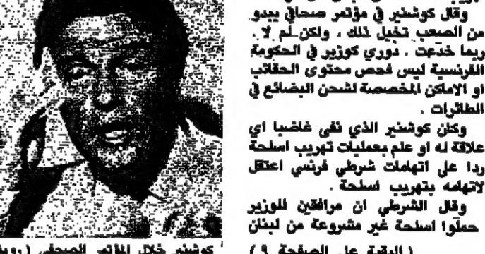
كوشنير خلال مؤتمر الصحفي

اعلن يرنار كوشنير وزير المساعدات الفرنسي امس ان رحلات الافة التي نظمتها وزارته ربما استخدمت في تهريب اسلحة من لبنان الى فرنسا. وقال كوشنير في مؤتمر صحفي يبدو من الصعب تجول ذلك، ولكن لا سيما فيما يتعلق في الحكومة الفرنسية ليس ضمن مستوى الخطاب او الامتنان المخصصة لشحن البضائع في الطائرات. وكان كوشنير الذي تلقى غاضبا اي علاقة له او علم بعملية تهريب اسلحة ردا على احداث شريطي فريدي اعتل لانهما يتهربين اسلحة. وقال الشريطي ان مراقبين للوزير حملوا اسلحة غير مشروعة من لبنان (البيقية على الصفحة ٩)